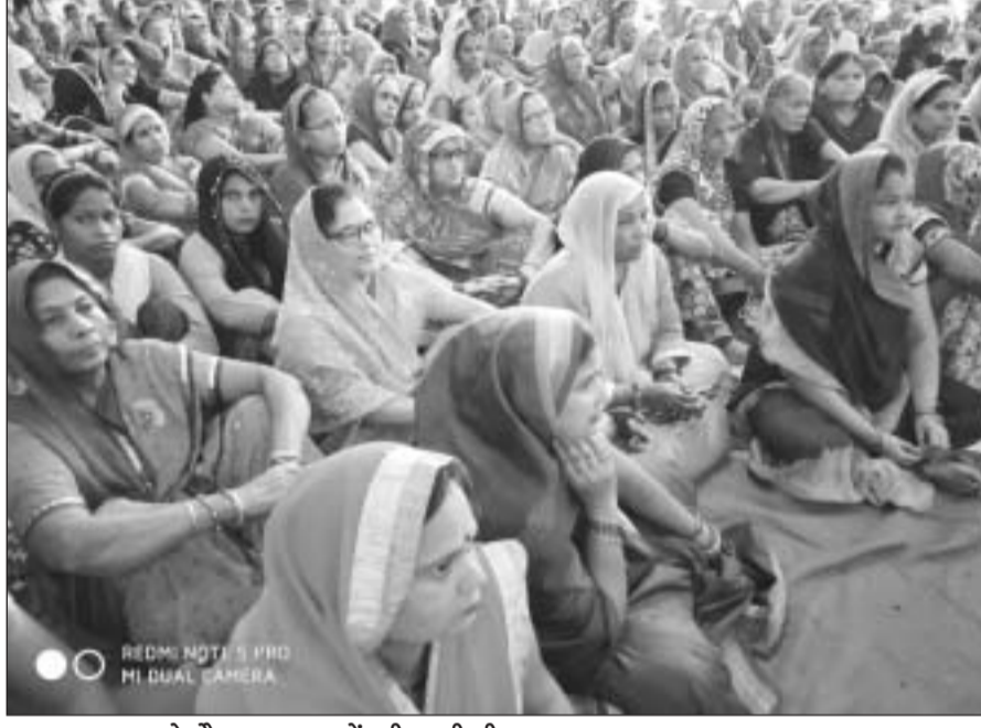
भागवत कथा के दौरान श्रद्धालुओं की उमड़ी भीड़।