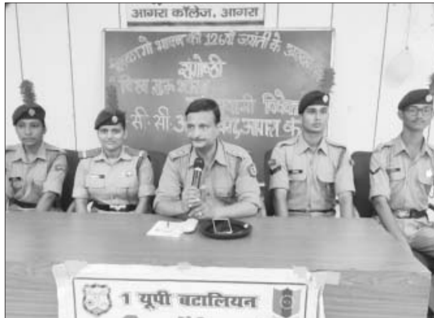
आगरा कॉलेज : गोष्ठी में पुलिस अधिकारी उद्बोधन करते।

आगरा। इनर सिंग रोड और लैड पार्सल के लिये वर्षों पूर्व भू-अधिग्रहण को लेकर मनमानी करने वाले अधिकारियों और कर्मचारियों के खिलाफ किसानों ने जांच के मुद्दे को जोर-शोर से उठाया था, जांच के बाद किसानों के आरोप सही पाये गये। जांच रिपोर्ट में एक पीसीएस अधिकारी का नाम तो उजागर कर दिया किन्तु बाकी का नहीं हो सका, इस पर किसानों अन्य दोषी अधिकारियों एवं कर्मचारियों ने नामों का खुलासा करने की मांग को लेकर दो दिन पूर्व कलकटेज