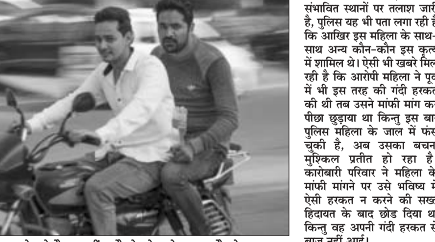
कड़े ट्रेफिक नियम के बाद भी सुपरने को तैयार नहीं, बगैर हेलमेट के बाइक दौड़ाते।

अनभिज्ञ रही। कई वर्षों का बिल अब 87 हजार रुपए भेज दिया, स्थानीय वसुली को लेकर वृद्धा विलास लाइनमैन आये दिन घर पहुंच कर बिजली काटने की धमकी देते हैं, इससे वृद्धा डरी हुई है। यदि बिजली काट दी तो उसे भारी परेशानी का सामना करना पड़ेगा। वृद्धा ने वरिष्ठ अधिकारियों से गुहार लगाई है कि बिल से सरचार्ज माफ कर विभाग का मूलधन जमा करा लिया जाये। उसकी कोई मदद करने वाला भी नहीं है, बस्ती के कुछ भले लोग बुलाये पर मदद को आ जाते हैं। स्थानीय बिजली विभाग की कारिस्तानी के चलते एक किलोवाट का कनेक्शन तीन किलोवाट में बदल दिया है, जबकि घर में एक पंखा, बल्व के