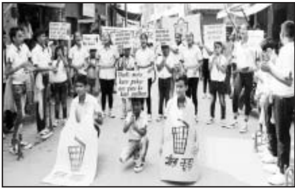
शहर में स्वच्छता अभियान के तहत नुक्कड़ नाटक करते डीपीएस स्कूल के बच्चों।

हाथरस। दिल्ली पब्लिक स्कूल, हाथरस का उद्देश्य यही है कि प्रत्येक छात्र का केवल शैक्षिक ही नहीं बरन सर्वांगीण विकास हो सके। इसी को ध्यान में रखते हुए विद्यालय में शिक्षण की परम्परागत पद्धति के साथ-साथ पाठ्येतर गतिविधियों, क्रिया कलाओं, पाठ्य सहायमी क्रियाओं का आयोजन किया जाता है ताकि यहाँ के प्रत्येक छात्र के अन्दर छिपी हुई प्रतिभा को बाहर आने व निखरने का मौका मिल सके। नुक्कड़ नाटक भी इन्हीं क्रिया-कलाओं में शामिल है। विद्यालय के छात्रों द्वारा नुक्कड़ नाटक का आयोजन कमला बाजार व सादाबाद गेट, हाथरस में वहाँ के नागरिकों को जागरूक करने के लिए किया गया। इस कार्यक्रम में कक्षा चार से कक्षा दस के