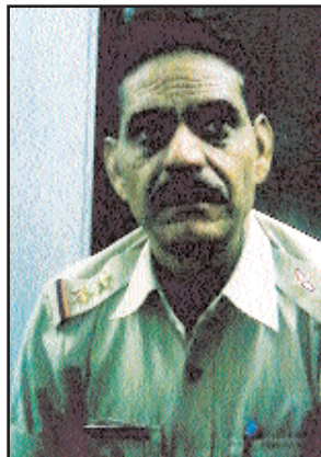
जिला अस्पताल लेकर आये। जहां से एक निजी अस्पताल में भर्ती करा दिया गया। वहीं पुलिस ने मैक्स व उसके चालक के खिलाफ कार्यवाही शुरू कर दी है।