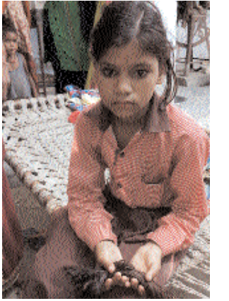
स्कूल पहुंचकर इसका विरोध किया। इतना ही नहीं शिक्षा विभाग के अधिकारियों से शिकायत की गयी। वहीं हैडमास्टरनी का कहना है कि बच्चों के सिर में थू जू थे इसलिए उसके बाल काटे गए हैं।

अलीगढ़। हरदुआगंज क्षेत्रान्तर्गत ग्राम दारापुर में स्कूल के ही एक छात्रा की हैडमास्टरनी द्वारा चोटी काट दी गई। जिसकी जानकारी पर बच्चों के परिजनों में आक्रोश व्याप्त हो गया। तत्काल शिकायत शिक्षा विभाग के अधिकारियों को दी गई। जिसकी जांच शुरू करा दी गई है।