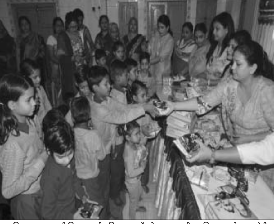
बाल दिवस पर सदर भट्ठी स्थित दाऊजी मन्दिर पर बच्चों को पाठ्य सामग्री का वितरण करते समाजसेवी।

vbxJA f'ud'k; p'uko "k'ar' i'k'z' l'e'l'u' d'j'k'us d's f'tyk' i'z'k' l' us d'ce'g' d'j' y' h g'a bl ds fy; s I H'h t; j'h' 0; ol'f'k' , a i'v'z' dj' y'h' x'bz' g's t'is' d'ek' ut'j' v'k' j'g'h' g's' m' l's t'Y'n' gh' i'k'j' fd; k' t'k' j'g'k' g'a f'ti l's ernku' fu'i'k' v'g' "k'ar' i'k'z' g's' i'k; A bl ds fy; s uxj' fuxe' ea l'kr' ernku' d'h'hai d's v'f'r' l'ou'n'k'y' ekuk x; ; k' g's f't'lg'ap'f'lg'r' dj' fy; ; k' x; ; k' g'a f'tys' ea d'j' 364 ernku' d'h'nc'uk; s; ; s'g' ; buea' 17 ernku' d'h'nc' x'ek' . k' v'p'y' ea v'f'r' l'ou'n'k'y' g'a ; g'la' v'f'r' f'd'r' Q'd' I ds v'y'ok' M'ku' d'k's' y'x'k; s' tkus dk Q'd' y'k' fy; ; k' x; ; k' g'a bl' h' r'j'g' fuxe' ea v'kus' o'k'ys' l'kr' v'f'r' l'ou'n'k'y' ernku' d'h'nc' i'j' H'h I s fux'j'k'uh j [Hh' t'k; x'BA i'z'k' l' us i'k; ; c'd' ernku' d'h'nc' dh l'ek'k' d'j' y' h g'a d'g'la f'druk Q'd' I p'f'ig; s bl' i'j' v'ire' fu' . k'z' g's' p'k' g's' j'z'k' l' us j'g'k' g' m' l's n'u'k'y' ernku' d'h'nc' d's y'c'j' g'a' o'g'la' i'fy' l' ds v'y'ok' i'k' , i' h' tok'ula' d's H'h r'u'kr' d'j'us dh ; k'st'uk' g'a