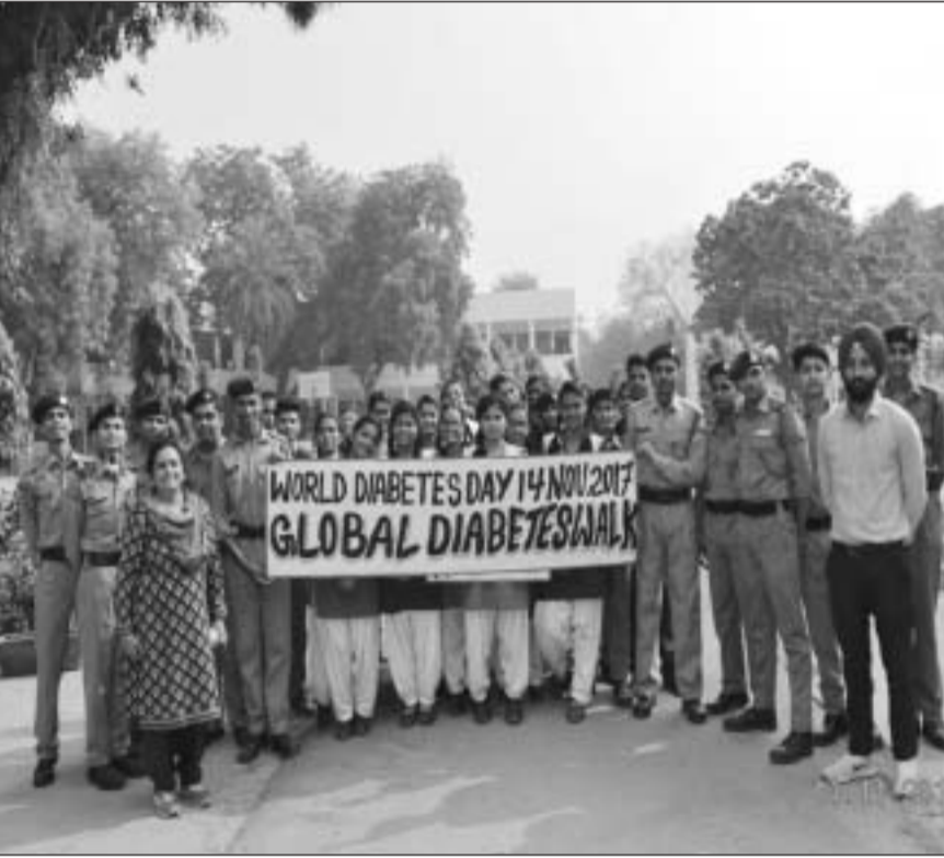
आर्मी पब्लिक स्कूल के छात्र-छात्राएँ स्वच्छता दिवस पर शपथ ग्रहण करते हैं।

vxkj&vyhx< e. My ea 23 yk [k Nk=&Nk=kvka us yh LOPNrk dh "ki Fk