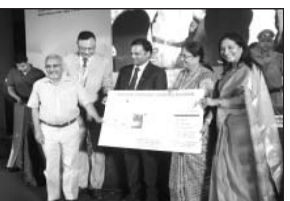
QMI h j k j v ; k f r d k ; z e a m i r j i [ M d h x o u ] c a h j u h e k j l s i j h i M o k M x e ' k h u d k f o r j . d j r i n l k F e a v i ; A & & & & & ; k v i t j a m l u t y a e a f d ' k k j h L o k F ; , o a e k f d e k e l o P N r k t i x ; d r k x s B h d k ; M k y , o a l s i j h i M o g M x e ' k h u f o r j . k d k ; z e v k ; k f r r f d ; k x ; k A b ; k u M k u i r M L d j L e f r j D y c 35 l y l ) y M i z v i x j j

vixjA lekt ea Qsh ekf d eke l cakh xyr voekj . k d n s n j d j u s v g e f y k v i a v i g f d ' k k j ; l a d i s e k g o j h c a k u l c a k h l g h t k u d j h n u s d s m i s ; l s i g y h d j v i x j A e a , d o g n L r j h ; l e k j g v k ; k f r r f d ; k x ; k A b l l e k j g d s t f j , n s k d h n i s J S B l L F k v a u s n s k H k j d s L h j e x f o ' k k i a d s l k F y c j e f y k v i a v i g f d ' k k j ; l a s e k f d e k e l o P N r k v i g c a k u d s f y , [ h y d j v i u h c r j j k u v i g f t k i k , a ' k r d j u s d k v o l j c n k u f d ; k A Q M j k u v v i d v i i V S V d y , M x ; u s y i t t d y l k l k ; V h v i d b i n ; k M Q M i h e v i g n s k e a e k f d e k e l o P N r k i j d e d j j g h u b u e n e v d h v i g l s ' k p o j k d s Q r g k c n j k M f l F r g l v y