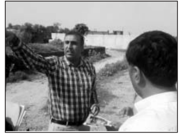
कमिश्नर निर्माण कार्यो का जायजा लेते

vixjA e. Myk; Dr vfuy d e j k u s v k t f u e l k / t h u ; ; j i k v z o r k t c j k t d k L F k y h ; f u j h k . k f d ; k A f u e l k / t h u ; ; j i k v z d s f u j h k . k d s n i g k u f u n s k a l ; ; j i k v z v F k j V h d i e n k l u s v k ; D r d s ; ; j i k v z u d l s d s v u d j m l g a l E i n k o l r n i F k r i s v o x r d j k ; k A f t l i j v k ; D r u s i r ; d l F k k u l a i j t k d j m l d k L F k y h ; f u j h k . k f d ; k A b l v o l j i j v k ; D r u s m l F k r y x k a l s m u d h t u & l e l ; k ; A H k l u h A b l n i g k u d n y x k a } j k k v i u h t e h u n u s d h c r d g h x ; h f t l i j v k ; D r u s v i j m l f t y / k d j h j t u a d r d s t e h u n u s o k y a d h l p h r s j k d j u s